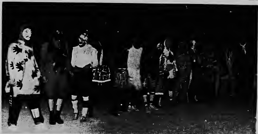
Un di e equiponan cu diarazon anochi a tuma parti den e partido di futbol disfraz den Wilhelmina Stadion. Dos tribuna completamente yena a presencia e partido entre e "loconan" cu a brinda e publico hopi momentonan di emocion y risa.

representa casi 600 biljechi di e rifa di AVB di cual nan e plaka no a ser entrega.